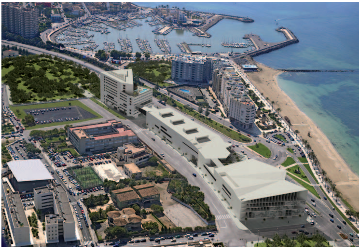
Simulación del nuevo Palacio de Congresos.