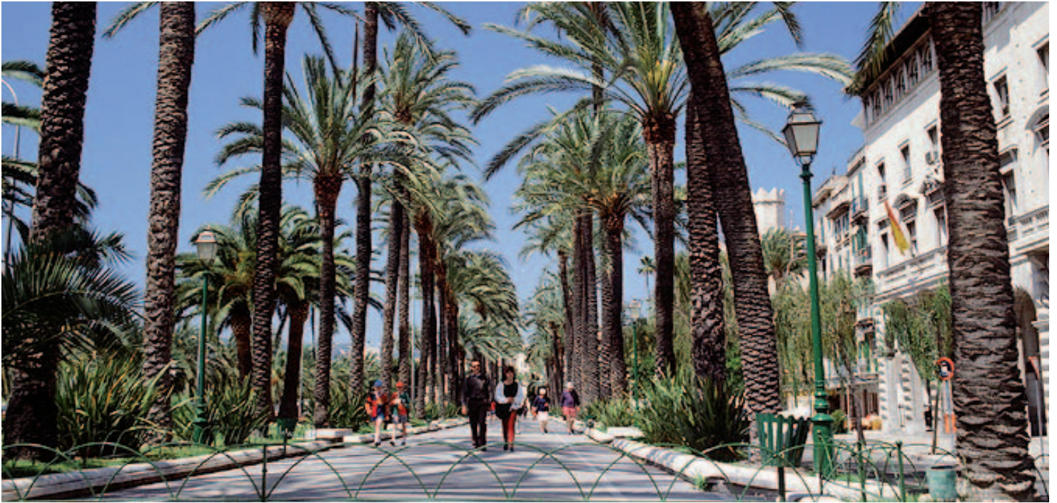
Paseo Sagrera.