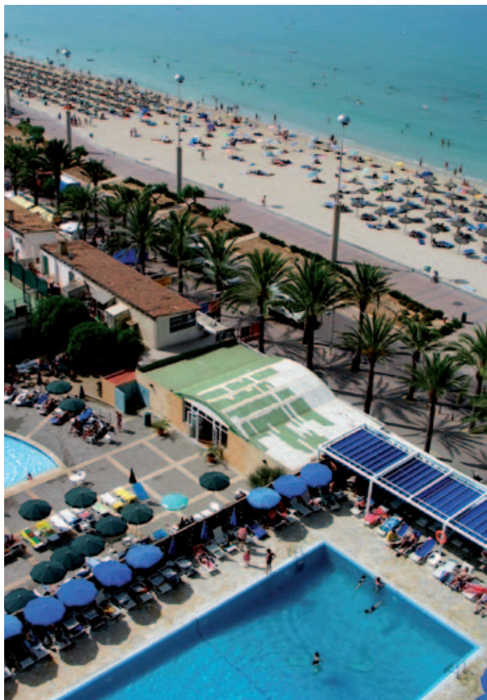
Playa de Palma.