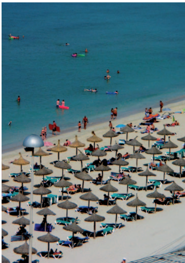
Playa de Palma.